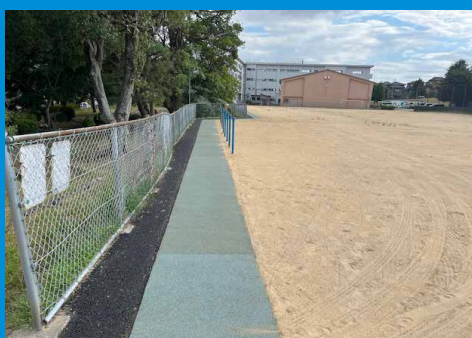
粟崎小学校 仮通学路設置