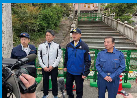
馳知事・下沢県議・村山市長 現地視察