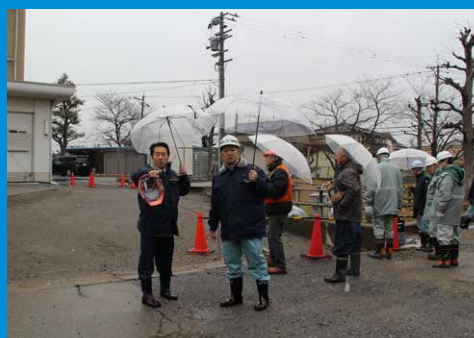
村山市長・関係部署現地視察